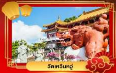
วัดเหวินทู่