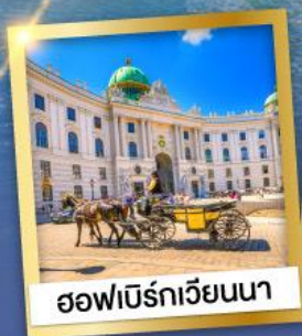
ออฟเบิร์กเวียนนา

เข้าชมความงดงามภายใน ของปราสาทนอยชวานสไตน์