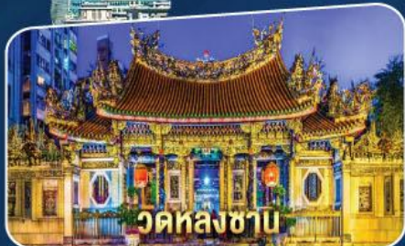
วัดหลงซาบ