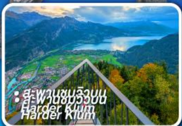
• ส.พานชมลิ้งบน Harder Klum