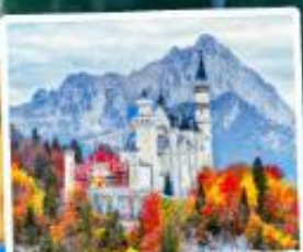
ปราสาทน้อยชวานส์ไตน์