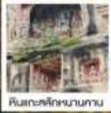
ศิลปะสถาปัตยกรรม