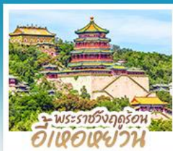
พระราชวังฤดูร้อน อี่เซว่น

ทริปเดียวเที่ยว 2 เมือง ปักกิ่ง-ต้าเหลียน • เที่ยวจีนฟูลยูโรป ณ เมืองวนิสาแห่งต้าเหลียน • สัมผัสประสบการณ์ขึ้นกำแพงเมืองจีน ด่านจวิยงกวน • ซ้อป ซิม ซิล ที่ถนนโบราณคกงวนและย่านชานหลี่กุน