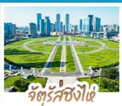
จัตุรัสชิงไผ่