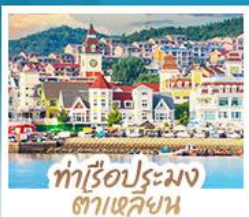
ท่าเรือประมง ต้าเหลียน