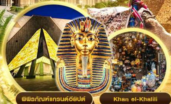
พิพิธภัณฑ์เกรנדอียิปต์