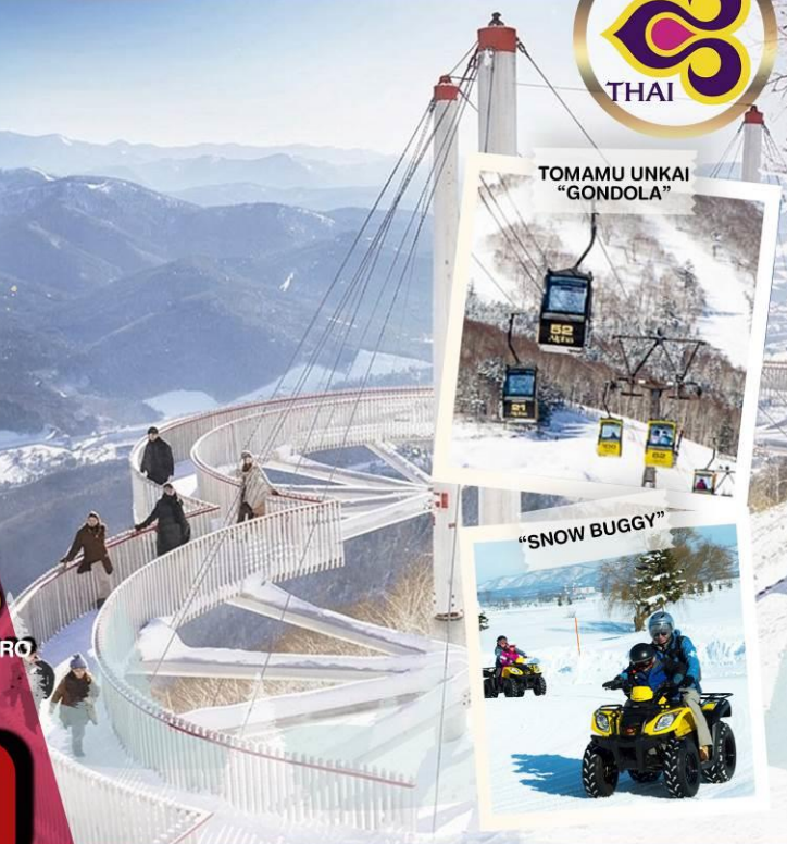
TOMAMU UNKAI "GONDOLA"