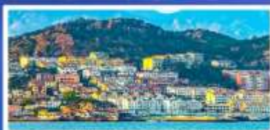
หมู่บ้านประมงซาโจ้ว