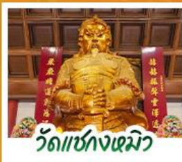
วัดเข่งหนิว