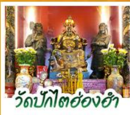
วัดปึกใต้ฮ่องฮ่า