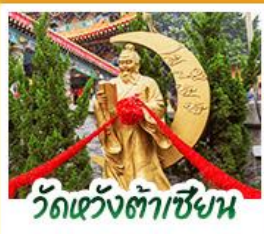
วัดเข่งต้าเซิน