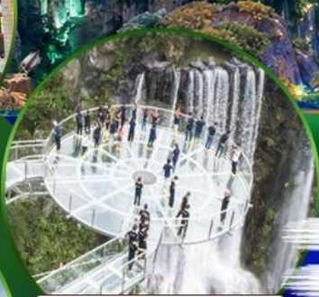
สะพานแก้วคู่หลงเซี่ยะ