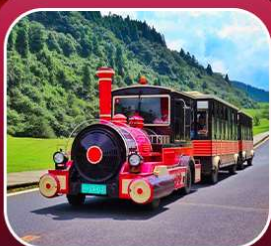
"อุทยานเขานางฟ้า"