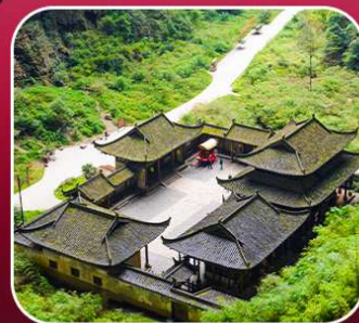
"อุทยานหลุมฟ้า"

T2G-CKG34(3U) The Best Chongqing...ฉงชิ่ง ต้าจู้ อุ่หลง เขานางฟ้า 5D 4N (3U)