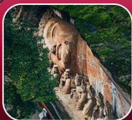
"ผาหินแกะสลักต้าจู้"