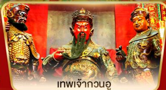
เทพเจ้ากวนอู