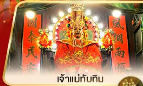
เจ้าแม่ทับทิม