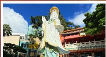
เจ้าแม่กวนอิมรัฟัสเบย์