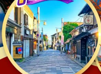
ถนนสายชาเขียว