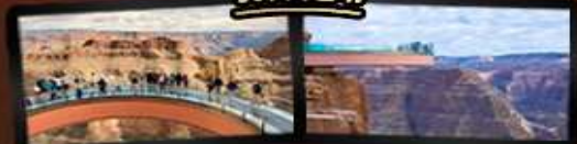
ชมความยิ่งใหญ่ของ GRAND CANYON WEST SKYWALK