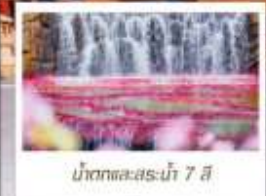
น้ำตกทะเลสาบไห่ 7 สี