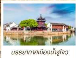
บรรยากาศเมืองน้ำซูโจว