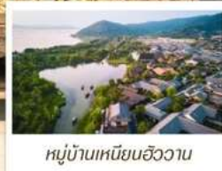
หมู่บ้านเหนียนฮิววาน

🧳 โหลด 23 KG. x1 ทั้งไป - กลับ ✓ พรีเมียมทิวส์ ✓ ไม่เข้าร้านรัฐบาล ✓ ทิวส์กรุ๊ปเล็ก ✓ รวมค่าเข้าสถานที่ตามโปรแกรม