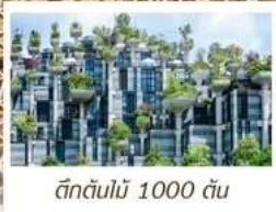
ตึกต้นไม้ 1000 ต้น