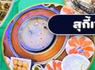
ชาบู แซลม่อน