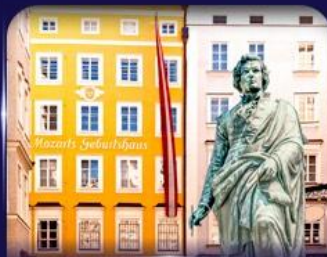
บ้านเกิดโมสาร์ท ซาลซ์บูร์ก