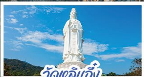
วัดเขลิเอ็ง