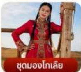
ชุดมองโกเลีย