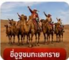
ขี้อูฐชมทะเลทราย