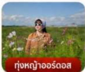
กุ่มหญ้าออร์ดอส