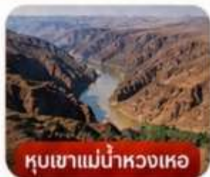
หุบเขาแม่น้ำหรงเหอ