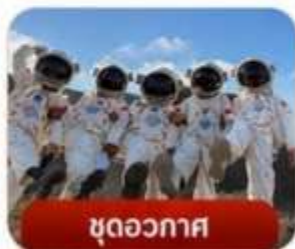
ชุดอวกาศ