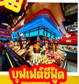
บูฟเฟต์ซีฟู้ด