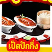
เปิดปีกกิ้ง