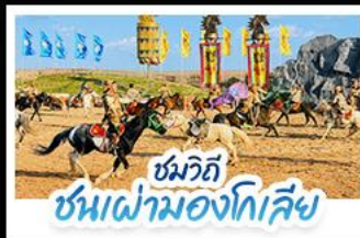
ชมวิถี ชนเผ่ามองโกเลีย

เปิดประสบการณ์ พักกระโจมมองโกเลียสุดพรีเมียมกลางทุ่งหญ้า สัมผัสบรรยากาศพระอาทิตย์ขึ้นสุดโรแมนติก ชมวิถีชนเผ่ามองโกเลีย พร้อมปาร์ตี้กองไฟใต้ท้องฟ้าเต็มไปด้วยความ • ตะลุยทะเลทรายอินเคินทาลา ทำรูปสุดปังกลางทะเลทรายสีทอง • เที่ยวครบทั้งทุ่งหญ้าแอร์ดอส วัฒนธรรมมองโกเลีย และเมืองสุดโมเดิร์นในกรณีเที่ยว แบบสวゆる ดูเพงทุกวัน