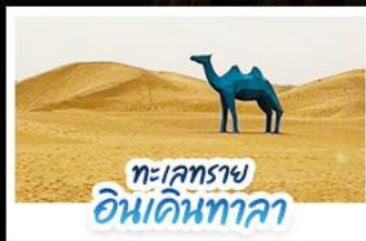
ทะเลทราย อินเคินทาลา