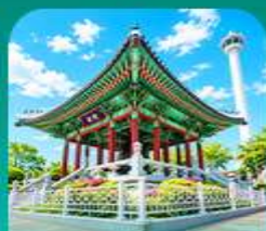
สวนเขงดูซาน