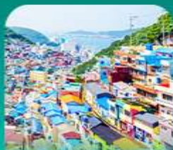
เมมูบ้านดัมเชอน