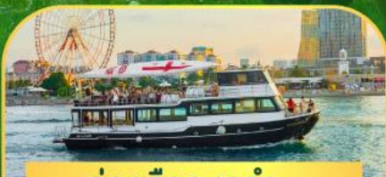
ล่องเรือทะเลดำ