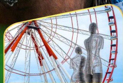
อนุสาวรีย์อาลีและนีโน่