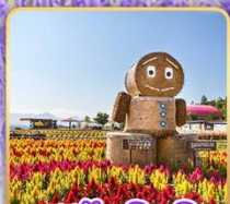
สวนซึกิไซโนะโอะกะ