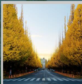
"ICHONAMIKI GINGO AVENUE"