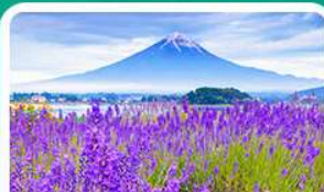
สวนโออิชิปาร์ก