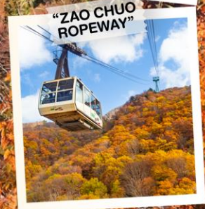
"ZAO CHUO ROPEWAY"

วันเดินทาง 30 ต.ค. - 5 พ.ย. 2569 4 - 10 พ.ย. 2569