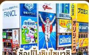
ช้อปปิ้งชินโซบาชิ และโดตงโบริ