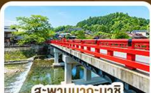
สะพานนากะบาชิ ทาคายาม่า