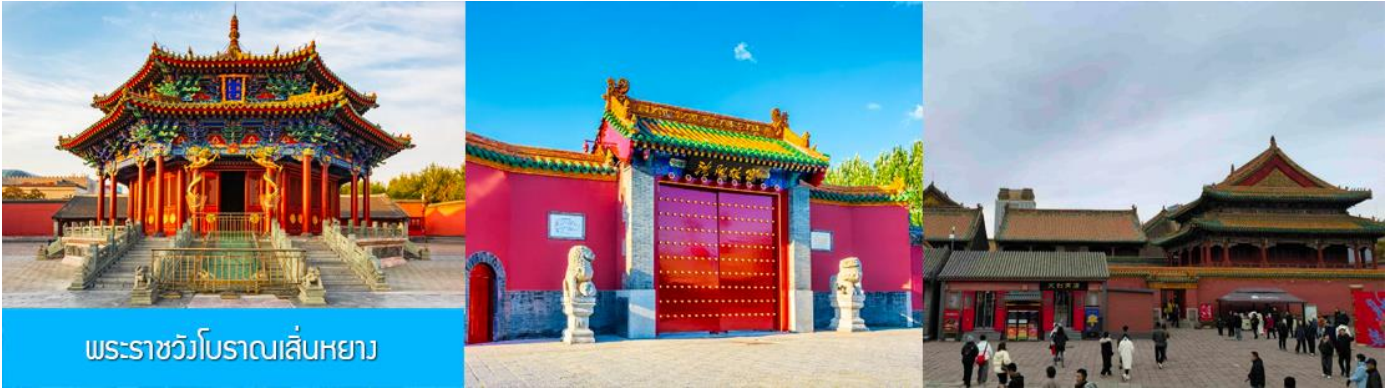
พระราชวังโบราณเสิ่นหยาง