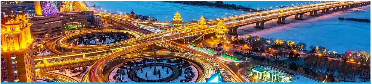
นครฮาร์บิน