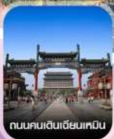
ถนนคนเดินเฉียนเหมิน

✈️ คอนเฟิร์มออกเดินทาง ทุกพีเรียด 2 ท่านขึ้นไป