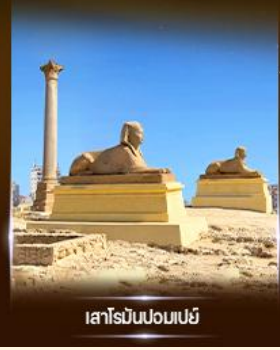
เสาสีบีนบองเบย์