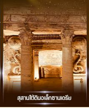
สุสานใต้ดินอเล็กซานเดรีย