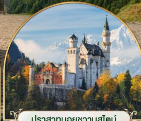
ปราสาทนอยชวานสไตน์ เยอรมนี