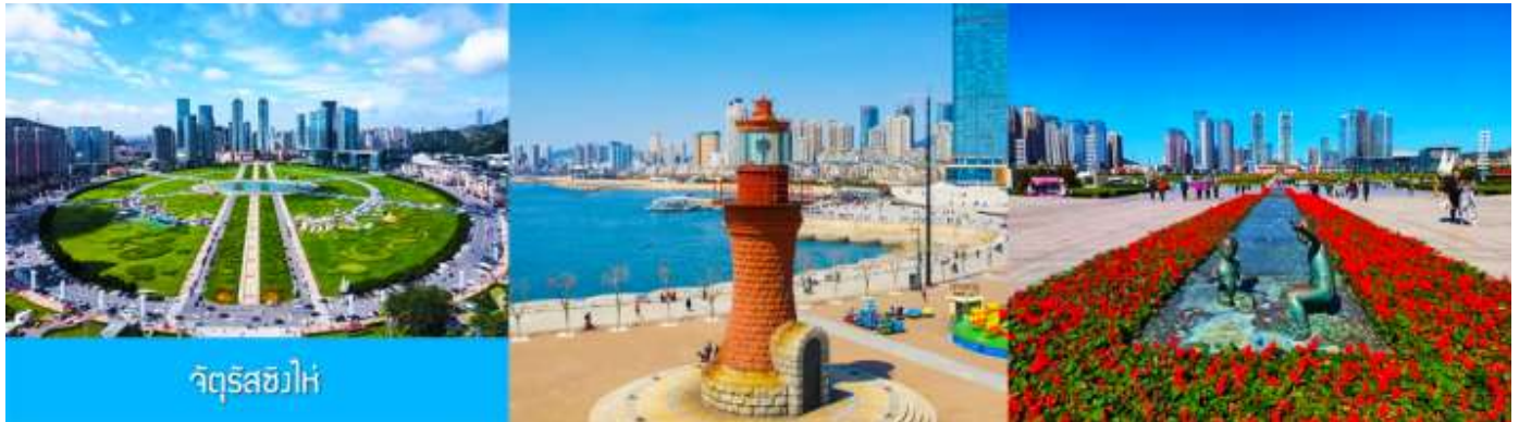
จัตุรัส星海

หลังอาหารนำท่านสู่ สวนเชอร์รี่ 樱桃园现摘樱桃 ให้นำท่านสัมผัสประสบการณ์สุดชิล ด้วยการเด็ดเชอร์รี่สดจากต้นภายในสวนเชอร์รี่ (เชอร์รี่จะของเมืองนี้จะเริ่มสุกและเก็บได้ในช่วงปลายเดือนพฤษภาคม - มิถุนายนของทุกปี ในกรณีที่ผลเชอร์รี่น้อยหรือหมดเร็วกว่าปกติ ทางทัวร์ขอสงวนสิทธิ์ในการจัดโปรแกรมอื่นแทนการเด็ดเชอร์รี่)