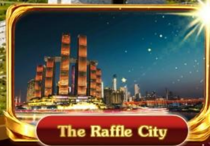
The Raffle City