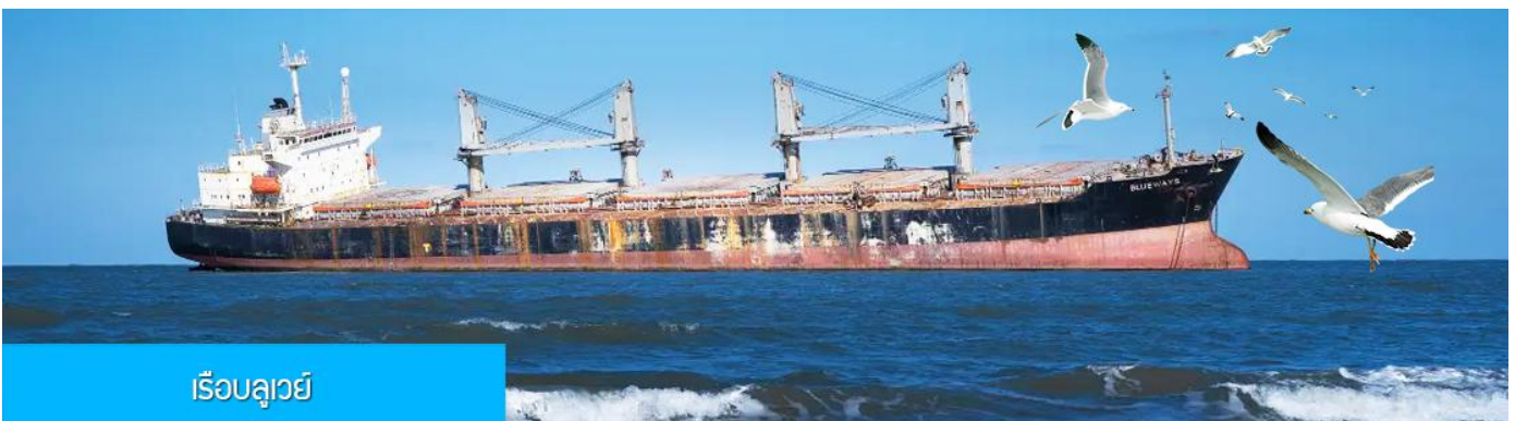
เรือบลูเวย์

เที่ยง รับประทานอาหารกลางวัน ณ ภัตตาคาร (5)