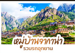
หมู่บ้านจากกาน่า รวมรถอุทยาน