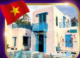
คาเฟ่สุดชิค ซานทรา มาริน่า