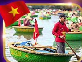
เรือกระด้ง หมู่บ้านกิมทาน