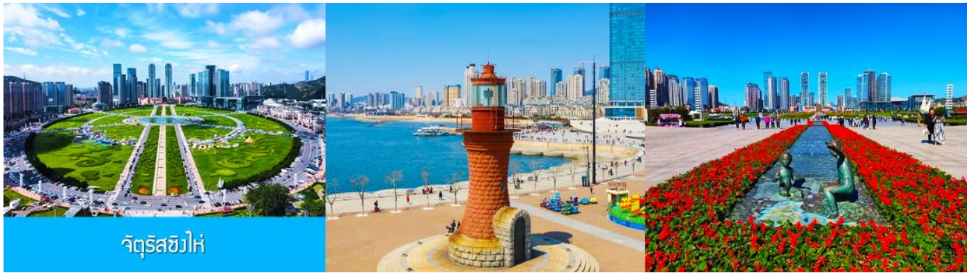
จัตุรัสชิงไห่

นำท่านเที่ยวชม จัตุรัสชิงไห่ 星海广场 เป็นจัตุรัสขนาดใหญ่เป็นแลนด์มาร์คสำคัญของเมืองต้าเหลียน สร้างขึ้นเพื่อเฉลิมฉลองในโอกาสที่รัฐบาลอังกฤษคืนเกาะฮ่องกงในให้จีนในปี ค.ศ. 1997 ตั้งอยู่ชายฝั่งทะเลในเมืองต้าเหลียน เป็นจัตุรัสใจกลางเมืองที่ใหญ่ที่สุดในโลกและเป็นแลนด์มาร์คของเมืองต้าเหลียน รายล้อมด้วยตึกระฟ้าที่ทันสมัย ภายในมีบ่อน้ำพุดนตรี ลานหญ้าขนาดใหญ่ และลานกว้างสำหรับจัดกิจกรรมกลางแจ้ง อาทิ เทศกาลเปียร์นานาชาติ การแข่งขันวิ่งมาราธอน งานแฟชั่นนานาชาติเมืองต้าเหลียน ฯลฯ