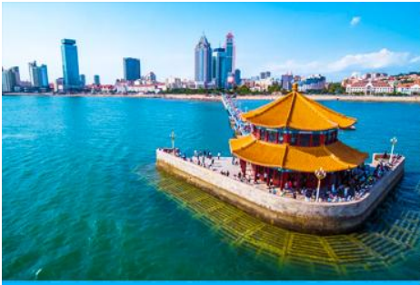
สะพานเจี้ยนเจียว