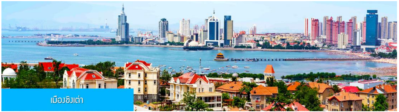
เมืองชิงเต่า