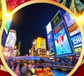
ช้อปปิ้งชินโซบาช