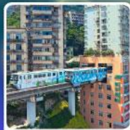
รถไฟฟ้า-อูตัก