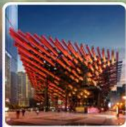
พิพิธภัณฑ์ศิลปะ-ตะเกียบ