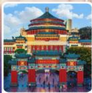
ศาลาประชาคมวงซิ่ง