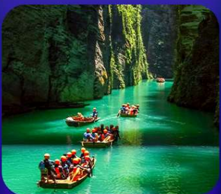
“ ผิงซานแกรนด์แคนยอน ”

เที่ยวจีน 2 มณฑล เสฉวน+หูเป่ย์ • ถ้าถึงหลง • หุบเขาสิงโต ซื่อจื่อกวน ล่องเรือมังกรกังสุ่ยชมวิวยามค่ำคืน • ผิงซานแกรนด์แคนยอน (รวมล่องเรือ) หงหยาดัง • จุดชมรถไฟฟ้าทะลุหิน • ตึกตะเกียบ • สือปาตี • หลงเหมินฮ่าว