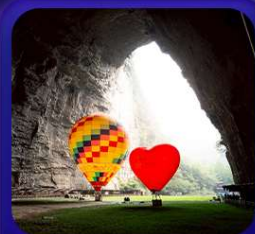
“ ถ้าถึงหลง ”