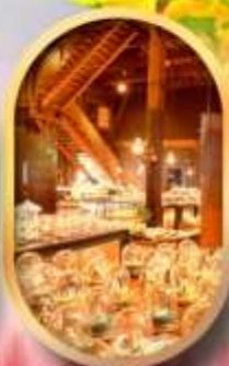
พพรกันทักล่องดนตรี