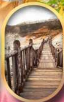
หุบเขาจโทกุตามิ