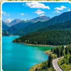
อุทยานเทียนชาน เทียนฉือ