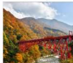
รถไฟชมวิวยุซุมเงาคุโรมะ