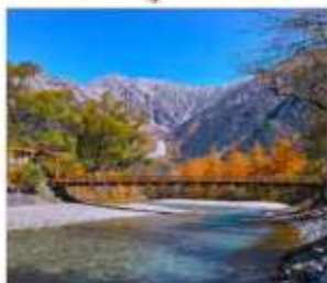
ดามิโดจิ