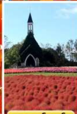
สวนบกกะโนะซาโตะ