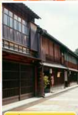
ย่านอิงาชิบายะ