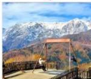
ฮาดุบะอิวาทาเกะ