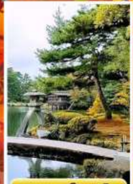
สวนเคนโระคุเอ็ง

☁️ ออนเซ็น 3 คั้น 🧳 นน.กระเป๋า 23 กก. ☀️ 7Days 5Night