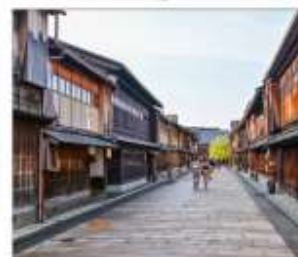
ย่านโรงน้ำชาอิงาชิซายะ