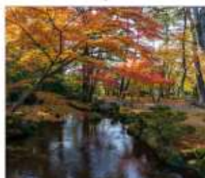
สวนเคนโระคุเอ็น