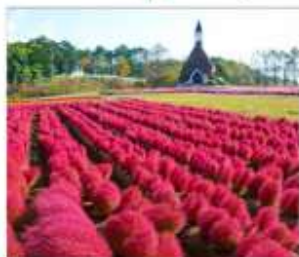
สวนดอกไม้ไม้กกระโนะซาโตะ