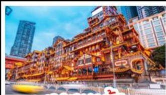
เจงเซยาตัง

อุทยานหลุมบ่อฟ้า - อุทยานเขานางฟ้า หงหยาดัง - นั่งรถไฟทะเลสาบ - อุทยานสี่ดรุณี ปี่ผิงโกว - สะพานหนานเฉียว